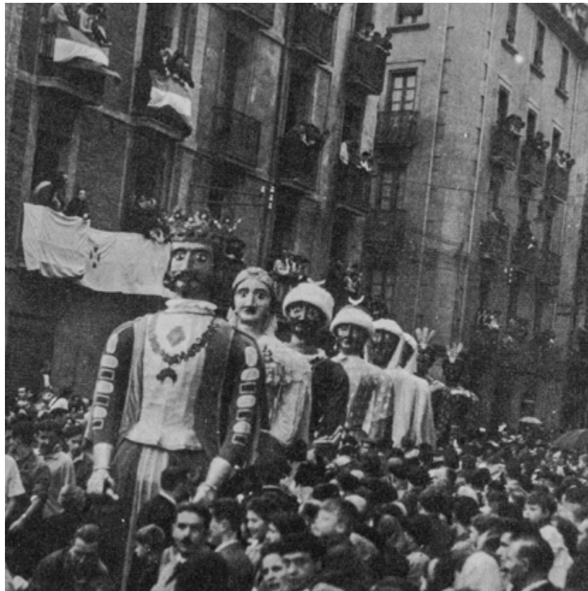
Toros en Pamplona (1969) diskoaren liburuxkaren barruko xehetasuna. Enciclopedia Taurina seriea, 2. liburukia. 12 hazbeteko biniloa. Hispavox SA. Argazkiak, zuri-beltzean: Rogelio Leal eta Francisco Galló.