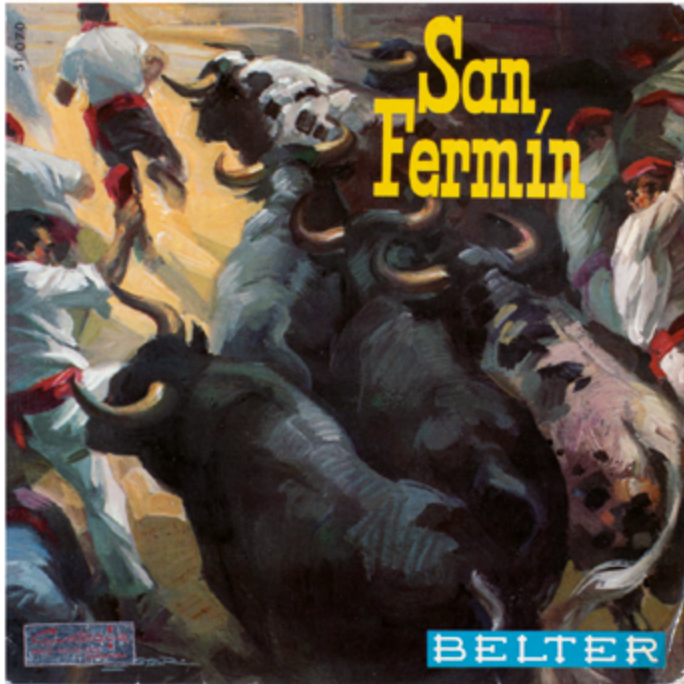
Rondalla Bidasoa – San Fermín (1965), Discos Belter SA. A1 Plaza del Castillo A2 Alegrías de San Fermín – Dianas A3 Levántate Pamplonica B1 Encierro – Las vacas del pueblo B2 Nos han dejado solos – Plaza de toros B3 El gato montés – Uno de enero.