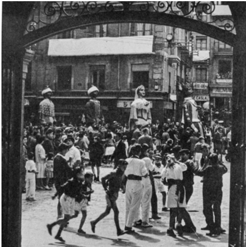
Toros en Pamplona (1969) diskoaren liburuxkaren barruko xehetasuna. Enciclopedia Taurina seriea, 2. liburukia. 12. hazbeteko biniloa. Hispavox SA. Argazkiak, zuri-beltzean: Rogelio Leal eta Francisco Galló.