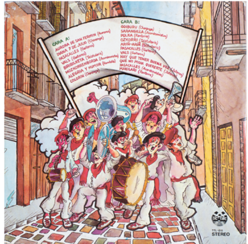
En la calle por San Fermin (1980). 12 hazbeteko biniloa. Tic-Tac.