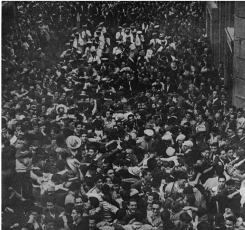
Toros en Pamplona (1969) diskoaren liburuxkaren barruko xehetasuna. Enciclopedia Taurina seriea, 2. liburukia. 12 hazbeteko biniloa. Hispavox SA. Argazkiak, zuri-beltzean: Rogelio Leal eta Francisco Galló.