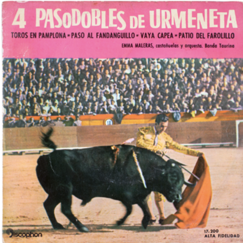
4 Pasodobles de Urmeneta (1962). 7 hazbeteko biniloa. Discophon. A1 Toros en Pamplona, pasodoblea A2 Paso al Fandanguillo, pasodoblea A3 Emma Maleras, kaskainetak eta orkestra B1 Vaya capea, pasodoblea B2 Patio del farolillo, pasodoblea B3 Banda taurina. A. Urmeneta.