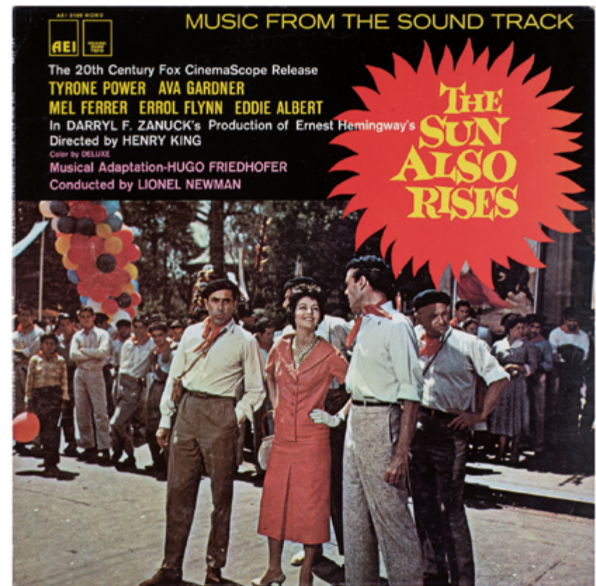
The sun also rises. Music from the sound track (1981). 12 hazbeteko biniloa. AEI Records. A1 Main title A2 Jake Barne's theme A3 The Bal Musette Cafe A4 Hospital memories A5 The Select Cafe B1 The Fiesta of San Fermin B2 Cantina B3 La Fiesta Brava B4 The beach at Biarritz.

Aurtengo kartelak bezala, zeinetan musikak paper protagonista baitu, programa honek festaren soinuak omentzen ditu euskarri fonografiko sorta baten bidez. Erabilitako erreprodukzioak zirkuitu komertzialetik kanpo dauden eta garai hartako diskoetxeek ekoitzi zituzten albumenak dira. Udalak arrazoizko ahalegin guztiak egin ditu disko bakoitzaren diseinuaren egilea egiaztatzeko eta egile-eskubideen titularrekin harremanetan jartzeko. Gerta daitekeen edozein akats edo omisio ez da borondatezkoa izan, eta kontaktatu ez den edozein pertsona gonbidatzen dugu Udalarekin harremanetan jartzera, aitorpen osoa egin ahal izateko.