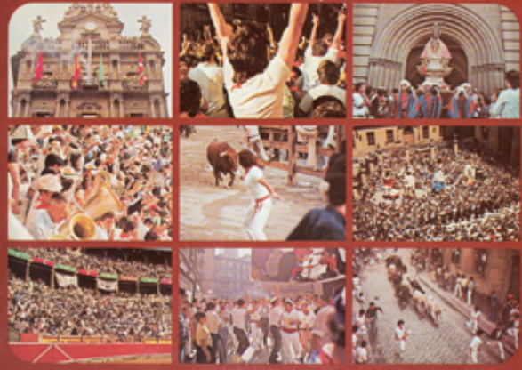
Izq. Un 7 de julio cualquiera. Con el chum-chum de las Peñas , 1978. Vinilo 12". Tic-Tac. Diseño portada: Informe S.A. de Publicidad A1 Himno de las Cortes de Navarra. Aldapa - M. Turrillas A2 Aldapa - M. Turrillas A3 Viva Navarra y sus Fueros A4 Alegría de Iruña - Patrón, Martínez A5 El carrico del helao - Popular A6 Anaitasuna - M. Turrillas A7 Tres cosas hay en Pamplona - Popular A8 Armonía chantreana - M. Turrillas A9 Bat bi hiru lau - Popular A10 Los del Bronce - Rodríguez, Arteaga A11 Manos arriba, esto es un atraco - Popular A12 El Bullicio Pamplonés - M. Turrillas A13 Ea, ea, ea, el bunker se cabrea - Popular / Arriba Detalle interior libreto disco Pamplona. Fiestas de San Fermín , 1958. Vinilo 7". Regal. Fotografía b/n: Zubieta y Retegui.