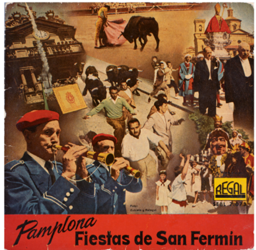
Pamplona. Fiestas de San Fermín, 1958. Vinilo 7". Regal. Fotografía: Zubieta y Retegui. A1 Campanadas. Pasacalle 'A los toros' – A. Urmeneta A2 'Riau-Riau'. La alegría de San Fermín – Astrain A3 Txistularis 'Arrate' Biribilketa – Zaraya B1 Dianas, El Encierro, Pasodoble 'El Gato Montés' – M. Penella B2 Jota Popular Navarra (Gaitas y Tambor) B3 'Uno De Enero', 'Pobre De Mi'.

Al igual que el cartel de este año, en el que la música tiene un papel protagonista, este programa homenajea a los sonidos de la fiesta a través de una muestra de soportes fonográficos. Las reproducciones empleadas pertenecen a álbumes que están fuera del circuito comercial y cuyas producciones se realizaron por sellos discográficos de la época. El Ayuntamiento ha hecho todos los esfuerzos razonables para acreditar la autoría del diseño de cada disco y para ponerse en contacto con los titulares de los derechos de autor. Cualquier error u omisión que pueda darse es involuntario y se invita a cualquier persona que no haya sido contactada a informar al Ayuntamiento para que se pueda hacer un reconocimiento completo.