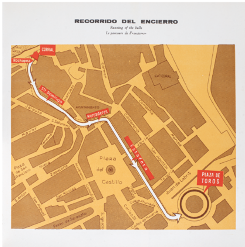
Detalle interior libreto disco Toros en Pamplona , 1969. Serie Enciclopedia Taurina Vol. 2. Vinilo 12". Hispavox S.A. Ilustraciones: A. Padial y J. Bernal.

Frontón Labrit pilotalekua Pelota. Remonte. Pala —Pilota. Erremontea. Pala • Ciudadela. Ziadadela Fuegos artificiales —Su artifizialak • Puesto de socorro. Sorospen postua Calle Olite 1. Plaza Recoletas —Erriberri kalea 1. Errekoleten plaza • Punto de información sobre agresiones sexistas. Eraso sexisten aurkako argibide-gunea Plaza del Castillo —Gazteluko plaza • Puestos de Policía. Municipal, Foral, Nacional. Polizia postuak. Udaltzaingoa, Forala, Nazionala Plaza del Castillo —Gazteluko plaza