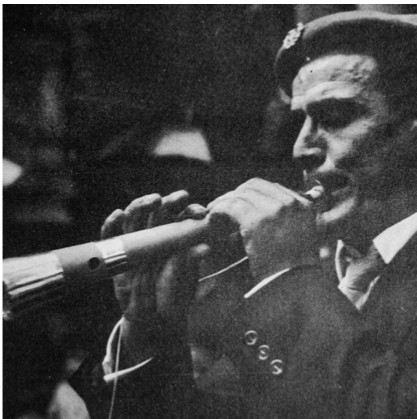
Detalle interior libreto disco Toros en Pamplona , 1969. Serie Enciclopedia Taurina Vol. 2 . Vinilo 12". Hispavox S.A. Fotografías b/n: Rogelio Leal y Francisco Galló.

Cuando el próximo 6 de julio de 2024, a las 12 en punto del mediodía, el cohete iniciador de las fiestas de San Fermín salga disparado desde el balcón municipal y surque los cielos de la plaza Consistorial, lo hará volando sobre una multitud enloquecida ante la inminencia de uno de los momentos más esperados del año. Habrá sido lanzado por una persona elegida por sus conciudadanas y conciudadanos, y pasará silbando sobre las cabezas de miles de jóvenes, hombres y mujeres dispuestos a disfrutar, en igualdad, de uno de los momentos más esperados del año.