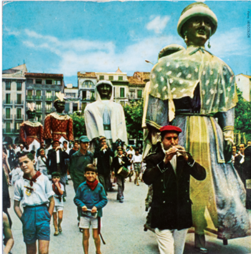
Detalle interior libreto disco Pamplona. Fiestas de San Fermín , 1958. Vinilo 7". Regal. Fotografía: Iriscolor.