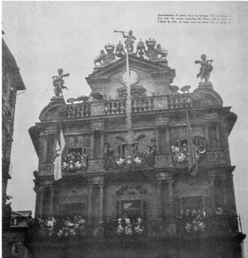
Detalle interior libreto disco Toros en Pamplona , 1969. Serie Enciclopedia Taurina Vol. 2. Vinilo 12". Hispavox S.A. Fotografías b/n: Rogelio Leal y Francisco Galló.