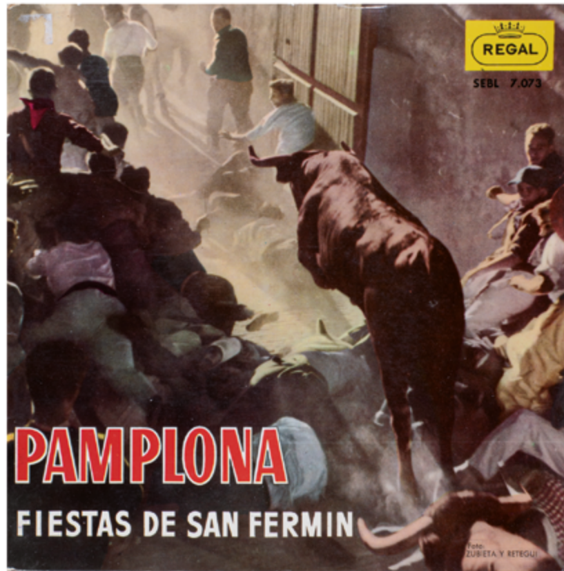
Pamplona. Fiestas de San Fermín, 1958. Vinilo 7". Regal. Fotografía: Zubieta y Retegui. A1 Campanadas. Pasacalle 'A los toros' - A. Urmeneta A2 'Riau-Riau'. La alegría de San Fermín - Astrain A3 Txistularis 'Arrate' Biribilketa - Zaraya B1 Dianas, El Encierro, Pasodoble 'El Gato Montés' - M. Penella B2 Jota Popular Navarra (Gaitas y Tambor) B3 'Uno De Enero', 'Pobre De Mi'.