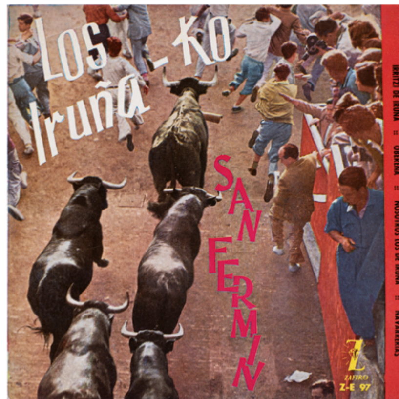
Los Iruña'ko. San Fermín, 1959. Vinilo 7". Zafiro.

Al entrar en la Plaza de Toros se refugiará con la mayor rapidez tras el vallado, dejándolo libre para quienes vienen detrás. No citará a los toros y dejará despejado el ruedo para la intervención de pastores y dobladores.