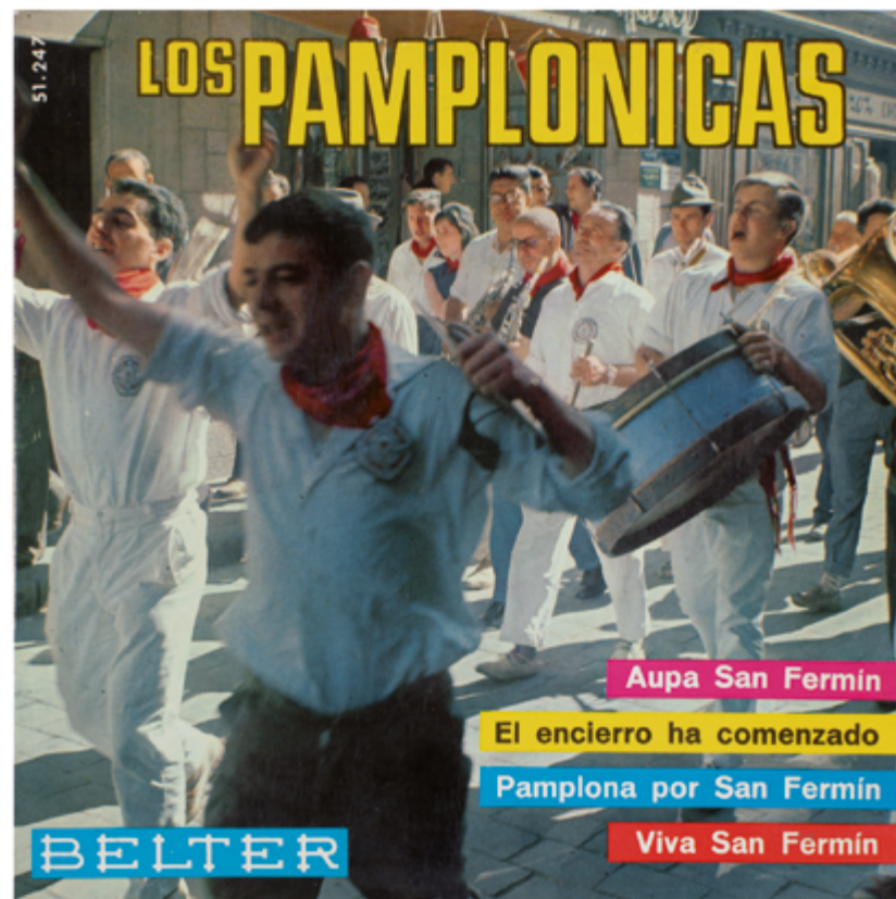
Los Pamplonicas , 1966. Vinilo 7". Belter. A1 Aupa San Fermín – Lazcano, Palomar A2 El Encierro ha comenzado – Zabalza B1 Pamplona por San Fermín – Barón, Turrillas B2 Viva San Fermín – Ameave.

Texto elaborado por XABIER ERKIZIA y el equipo de FRANZISKA en homenaje a los sonidos de las fiestas de San Fermín